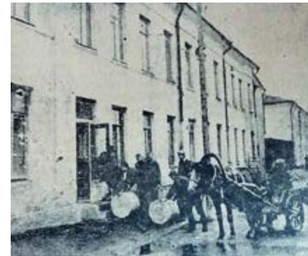
Здание издательства и редакции газет «Новый путь», «Колокол», журналов «На переломе», «Бич», «Новая жизнь» на Театральной площади (до войны — улица Карла Маркса, ныне — площадь Ленина) в Смоленске напротив Театра драмы («Новый путь». 1942. № 81. 15 октября)