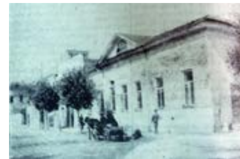
Здание на Крепостной улице (в советское и в настоящее время — Красногвардейская), где в августе 1942 года был открыт Народный театр. («Новый путь». № 73. 17 сентября)

23 августа 1942 года в здании бывшего детского кинотеатра (Крепостная ул., дом 5) был открыт Народный театр 89 .