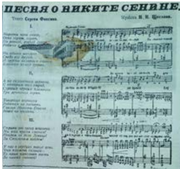
(«Рабочий путь». Смоленск. 1935. № 43. 21 февраля)

На страницах местной газеты «Рабочий путь» выходили его обстоятельные статьи, издавались композиции 147 .