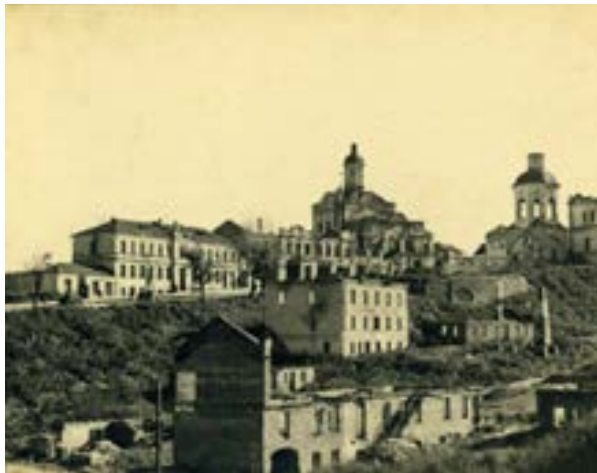
Вид на Главную улицу (до оккупации — Советская) в Смоленске в годы войны 46

В Смоленске, где накануне войны было 165 тысяч жителей, к концу 1941 года, по приблизительным подсчетам, осталось около 50 тысяч человек, по преимуществу женщин, стариков и детей 43 . Многие оказались без средств к существованию, потеряли не только жилье, но и все имущество. Вместе с тем три четверти пригодных для жизни домов в городе было разрушено 44 . Подавляющая часть населения голодала, в 1941 году в городе случались голодные смерти 45 .