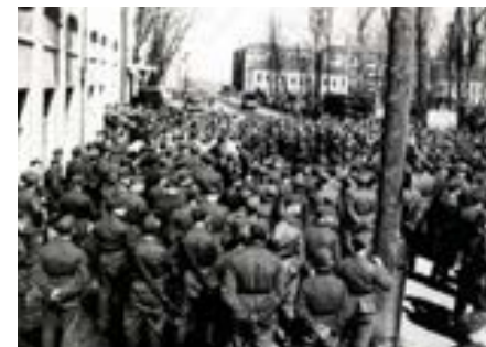
Концерт для немецких солдат в Смоленске на улице Ильинская (в советское время — улица Октябрьской революции) рядом с городским парком «Блонье»

Молодой оркестр популярен — он желанный участник городских концертов, его тепло встречают немецкие солдаты в воинских частях. И совершенно трогательно бывает, когда они начинают тихонько подпевать оркестру, исполняющему старинную русскую песню о донском казаке. И тогда ширится песня в этом дуэте германских солдат и русских домристов, звучит могучей думой о великой матушке-Волге и буйном Степане 74 .