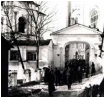
Немецкие солдаты выходят из Успенского кафедрального собора, где в начале оккупации проводились также лютеранские богослужения.