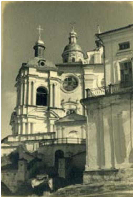
Смоленский Успенский кафедральный собор в годы войны 124

Когда в Смоленской области еще шли кровопролитные бои, но сам Смоленск уже находился под властью немцев, 10 августа 1941 года, в день празднования иконы Смоленской Божией Матери, был освящен кафедральный Свято-Успенский собор, после чего в храме была совершена первая после восемнадцатилетнего перерыва литургия.