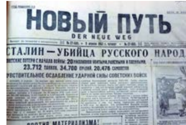
Страница смоленской коллаборационистской газеты «Новый путь» (1942. № 27. 9 апреля)

Газета выпускалась Смоленской городской управой и издавалась два раза в неделю тиражом в 70 тысяч экземпляров. (Иногда тираж доходил до 100 тысяч 10 ).