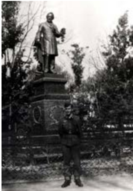
Немецкий солдат возле памятника М.И. Глинки в Смоленске в парке «Блонье»