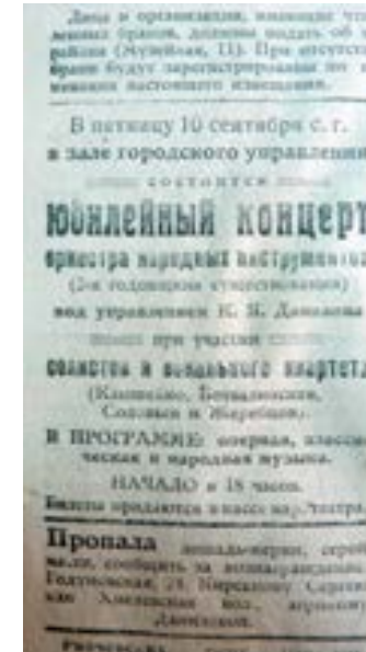
Объявление в газете «Новый путь» (1943. № 65. 19 августа)

Миклашевич, исполнявший русские пляски 75 . Концертная жизнь в последующие месяцы явно шла crescendo .