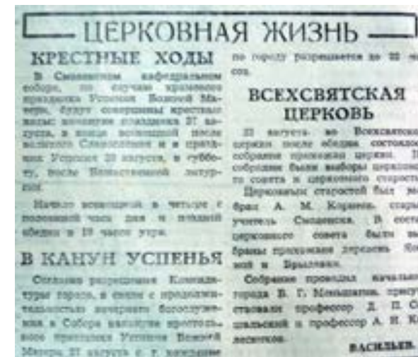
(«Новый путь». 1943. № 65. 19 августа)

Первое Рождество в оккупированном Смоленске по распоряжению новых властей отмечалось дважды: по старому и новому стилям, 25 декабря и 7 января. 1 января 1942 года был совершен новогодний молебен. 5 апреля в соборе праздновали Св. Пасху: в 5 утра началось чтение Апостола, через час последовала полунощница, в 7 утра — заутреня и крестный ход, в 9 утра — литургия, в 4 часа дня — вечерня 128 .