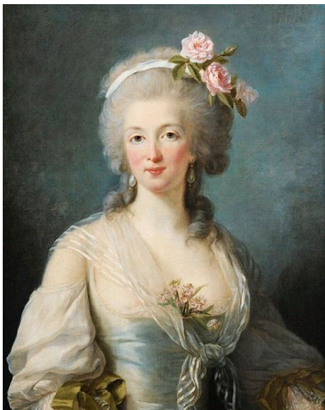
Илл. 20. Жанна де Ла Мотт Неизв. художник