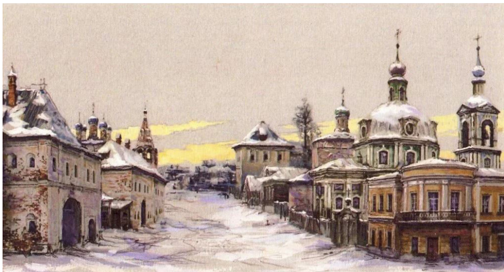
Илл. 2. Улица Солянка в конце XVIII в. Худ. В.А. Рябов, 2006.