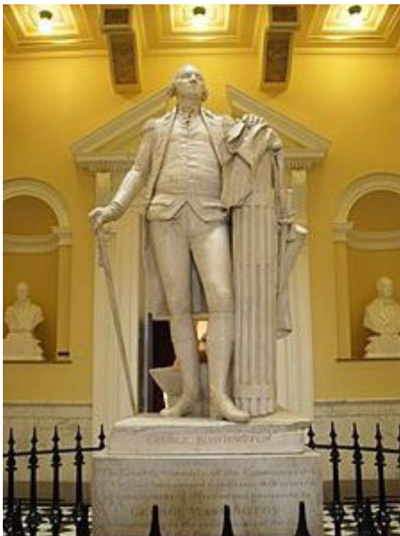
Илл. 5. Статуя Джорджа Вашингтона. Скульптор Ж.А. Гудон. Капитолий Вирджинии

С. 71. Желающие купить фортопиано аглицкое очень хорошее, могут адресоваться к г. Карто , живущему в 6 части, 2 квартала под № 108.