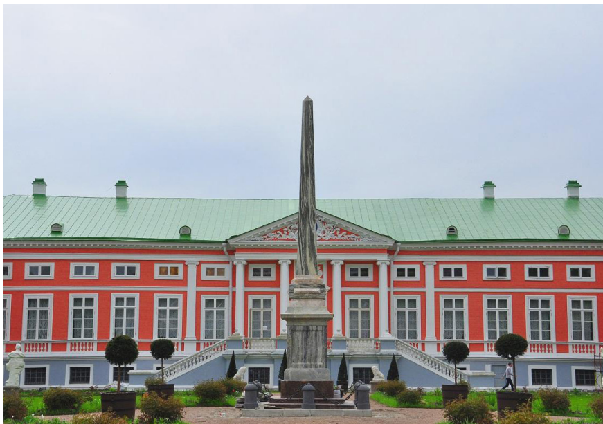
Илл. 24. Обелиск в Кусково. Современное фото

При наступлении ночи, по данному пущенною ракетой сигналу, в короткое время осветился весь сад, причем наибольшее привлекали на себя особенное зрителей внимание искусно иллюминированные разными огнями как вновь воздвигнутый обелиск, так оранжерея и яхта. Тихость прекрасной летней ночи, сопровождаемая благоуханным и ароматным воздухом, от расставленных по всему саду оранжевых деревьев, услаждали чувства всех и каждого, а притом и великое множество стекшегося в сей день отовсюду народа всякого звания, которому доставлены были разного рода забавы и невозбраняемо было гулять по всему просторному Кусковскому саду, составляло наиприятнейшее и великолепнейшее для глаз зрелище.