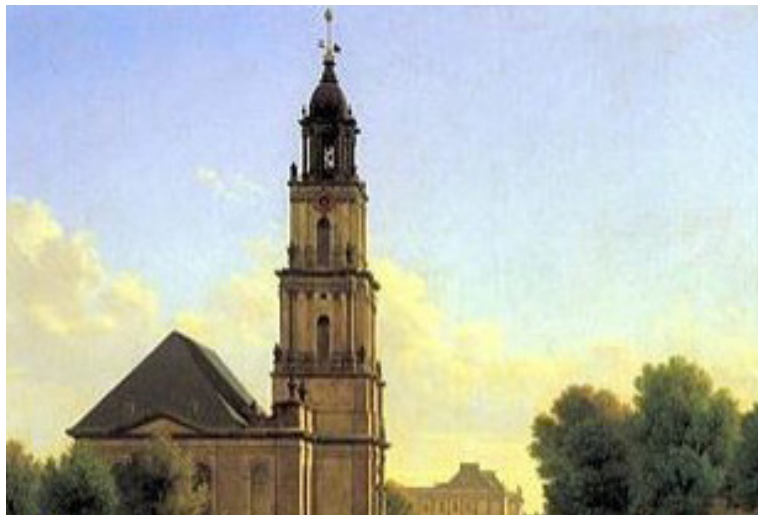
Илл. 27. Гарнизонная церковь в Потсдаме. Худ. К. Хазенпflug, 1827

Церковь освещена будет несколькими тысячами траурных лампад... <...> Окошки домов по улице, по которой будет шествие от Королевского Дворца до гарнизонной церкви и коих число не с большим 300, все уже заблаговременно наняты любопытными зрителями и в верхних этажах заплачено за каждое окошко по 10, а в нижних по 8 талеров. Сверх того, по улице сделаны по обеим сторонам высокие подмостки в 7 рядов, где также за каждое место платят по 1 талеру.