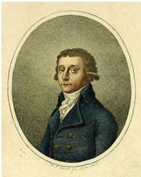
Илл. 26. Антонио Сальери. Гравюра К. Т. Риделя по рис. Г. Э. Штайнхаузера фон Трауберга, 1802

была 3 раза перед многочисленнейшим собранием. Сами итальянцы говорят, что музыка немецкого композитора есть совершеннейшее в своем роде произведение.