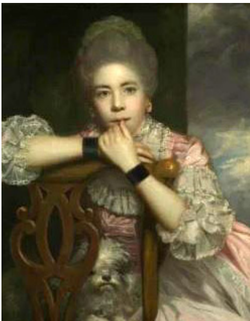
Илл. 18. Портрет мисс Абингтон. Худ. Дж. Рейнольдс

Вчера была в церкви Св. Павла церковная музыка, и зрелище гораздо трогательнее Вестминстерского. Это были 6398 мальчиков и девочек, кои яко сироты добровольными подаяниями благомыслящих особ одеты в новое платье, накормлены, научены и на сооруженном в церкви амфитеатре пред несколькими тысячами собравшихся зрителей прославляли цену благодетельной добродетели, и с молчанием взывали к достаточным особам: поди и ты сделай тоже.