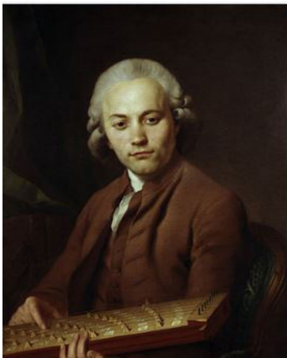
Илл. 3. Аббат Фоглер. Неизв. худ., 1790