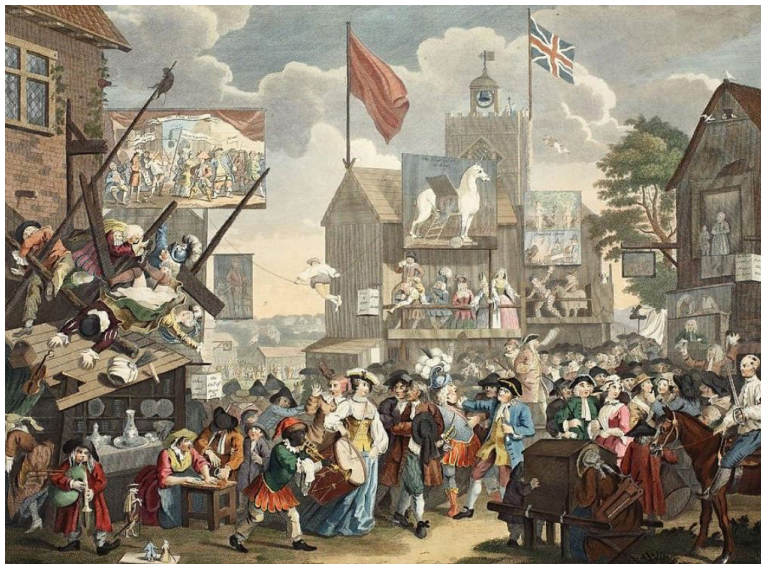
Илл. 15. Ярмарочный театр в Саутворке, Лондон. Графюра Э.Л. Рипенхаузена по оригиналу У. Хогарта. Первая половина XIX в.

С. 419. В приходе Успения на Покровке, в 5 части, 3 квартала, под № 236 продаются <...> хорошие гусли.