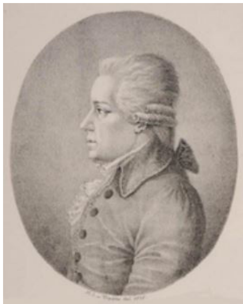
Илл. 12. Карл фон Диттерсдорф. Худ. Х. Э. фон Винттер, 1816