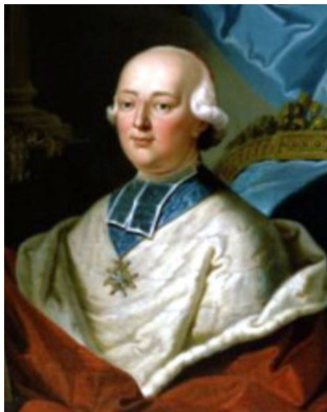
Илл. 21. Кардинал Луи де Роган Неизв. художник