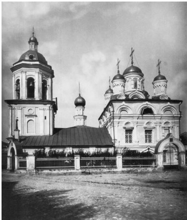
Илл. 23. Церковь Иоанна Богослова в Бронной слободе. Фото нач. XX века