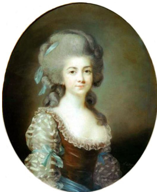
Илл. 13. Антуанетта Сент-Юберти. Худ. Э. Виже-Лебрен, 1780