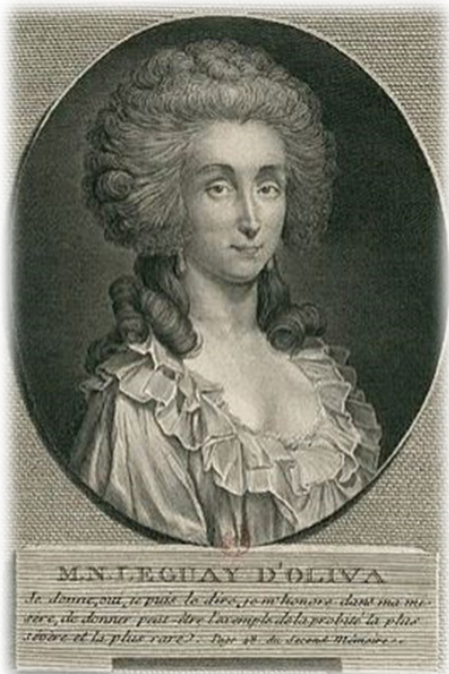
Илл. 22. Портрет Николь д'Олива Гравюра по работе неизв. художника