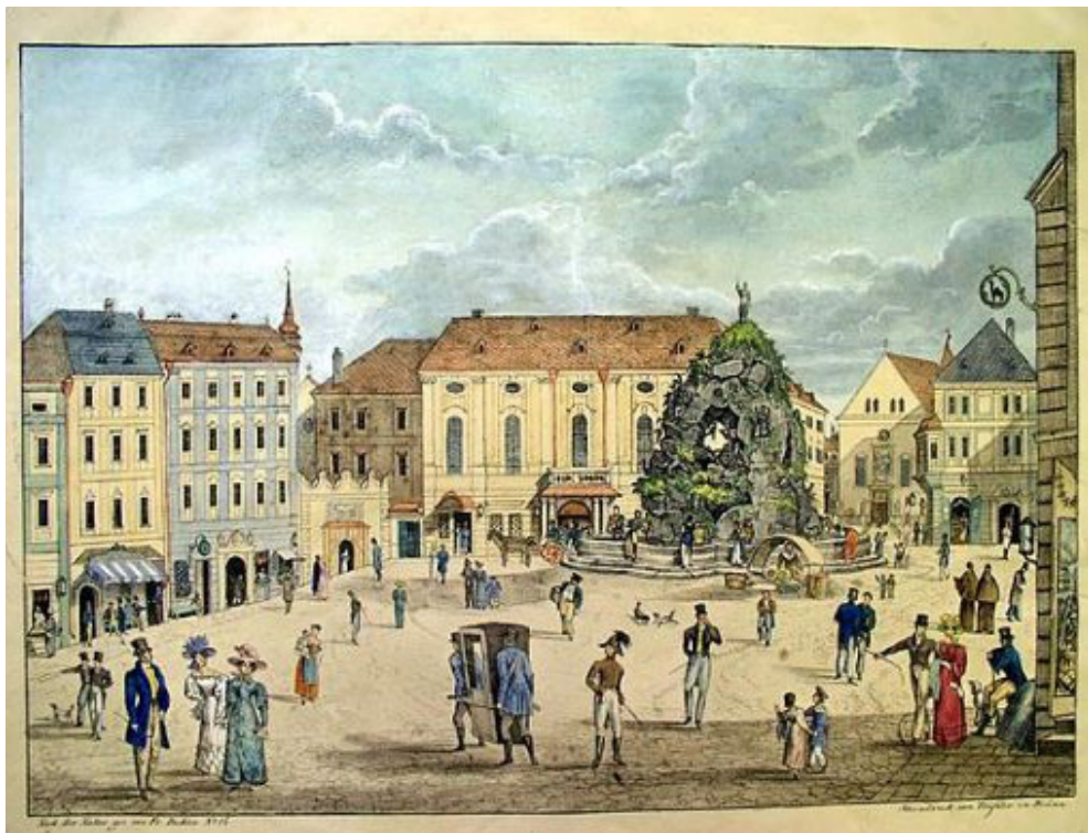
Илл. 8. Театр Редута в Брюнне, ныне Брно (в центре). Литография, 1827