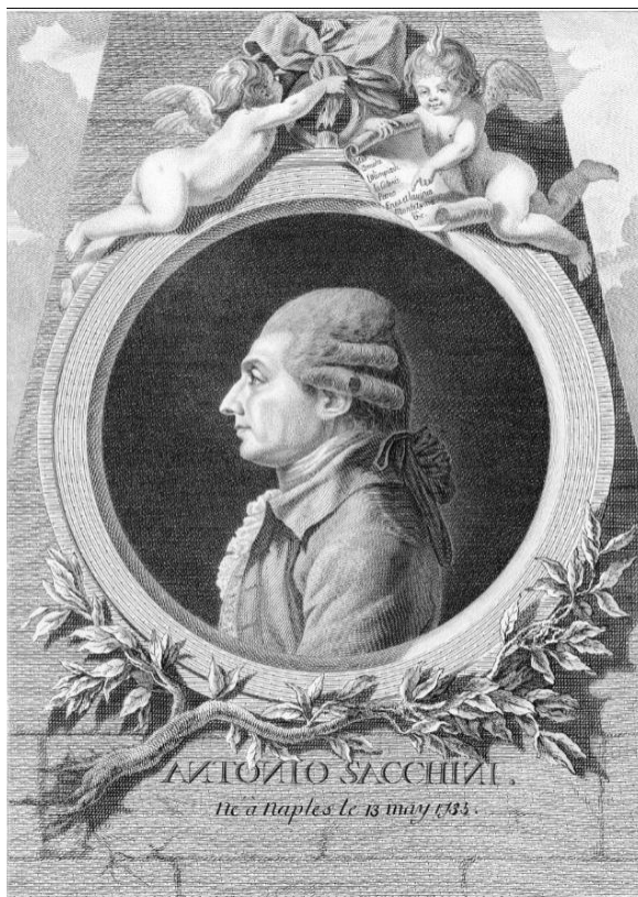
Илл. 28. Надгробие Антонио Саккини, церковь Сент-Эсташ, Париж

маршалских прав, наказана будет примерно. На другой день опубликовано повеление, в силу которого всем актерам и актрисам как польским, так и иностранным, объявляется вести себя впредь с большой усердностью и отдавать публике подобающее уважение, в противном же случае таковые оскорбления наказываемы будут строжайшим образом без всякой пощады.