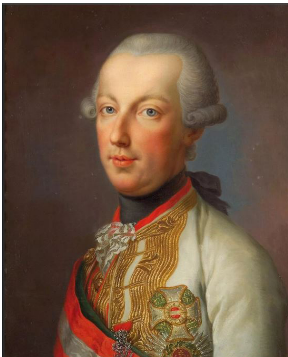
Илл. 10. Портрет графа Фалькенштейна (австрийского императора Иосифа II). Худ. А. фон Марон (?)