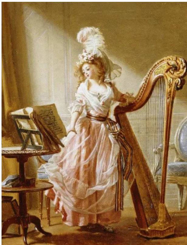
Илл. 29. Арфистка. Худ. М. Гарнье

и Победоносца Георгия] ... во время стола играла итальянская музыка с хором придворных певчих.