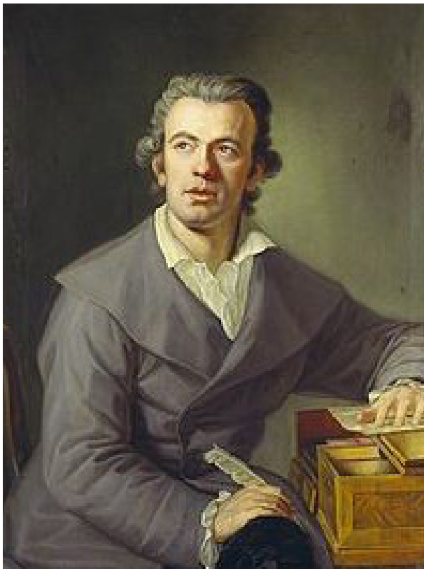
Илл. 7. Композитор И.Г. Науман. Худ. Ф.Г. Науман, 1780

Великолепное празднество в Шёнбрунне дано будет 7 числа сего месяца. <...> Шествие начнется в 1 ½ часа и состоять будет из ... 40 особ: