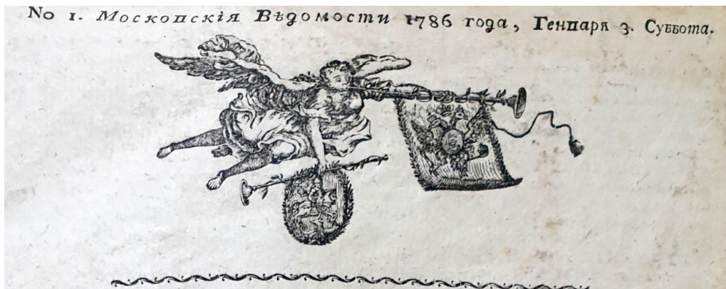
Илл. 1. Заставка к номерам Московских ведомостей в 1786 году