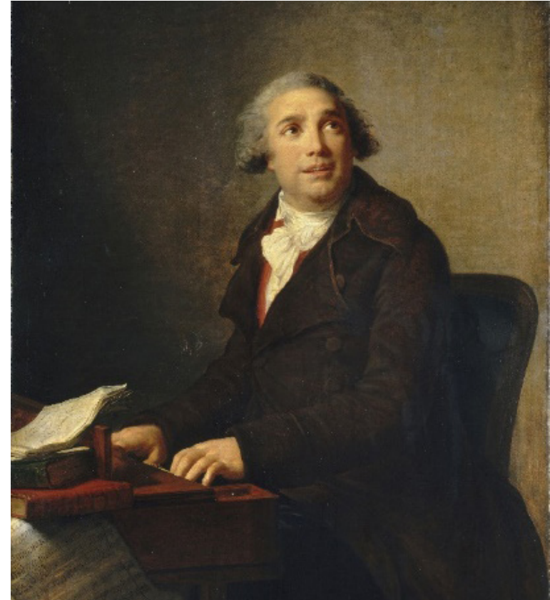
М.-Э.-Л. Виге-Лебрен. Портрет Джованни Паизиелло. 1791. Х., м. Национальный музей-замок Версаль и Трианон

Нетерпеливый от гения, который его терзает, он иногда делает эскизы, в то время, когда надо рисовать; он не всегда имеет время для усовершенствования. Он неровен; его стиль одновременно живой и нежный, оборот мыслей и фраз всегда непредвиденный, заставляют рассматривать его, как одного из самых возвышенных оригиналов. Он сочинил несколько Трагедий, из которых самая лучшая «Поражение Дария». Но он преобладает и первенствует, главным образом, в комическом жанре. Китайский Идол, Учтивый Араб, Фальшивая истина, Сократ, Три Графини, Фраскатанка и т.д. служат многочисленными доказательствами этому. Трудно было бы объединить больше контрапункта с большим количеством пения; больше свободы, тонкости, нежности с большей энергией, теплом и радостью. Я бы хотел назвать его сыном Граций, к которым приближался Сатир. В Неаполе есть два маленьких Театра; один, называющийся Театром Флорентинцев, посвящен комическим шедеврам Пиччинни; другой, называемой Новым Театром, предназначен для шедевров Паизиелло. Первый подобен Книдскому храму, где все носит отпечаток веселья Венеры, которая приходит