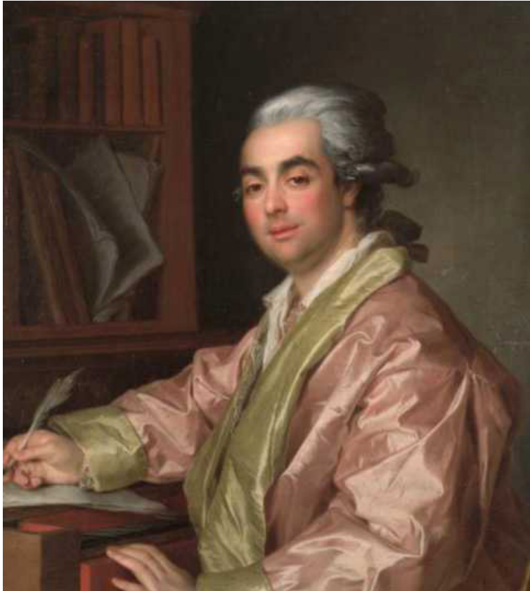
Д. Г. Левицкий. Портрет неизвестного музыканта (Дж. Паизиелло?). 1781. Х., м. 79,5×66,5. Национальный художественный музей Республики Беларусь, Минск

(1772—1835), будет называть Паизиелло «отличнейшим Композитором музыки», в котором еще в юные лета обнаружилось «в особенности свойственное ему веселое расположение духа и необыкновенный гений (курсив мой.— А. С.)» 2 . По мнению Кушенова-Дмитревского, «из числа сочиненных им (Паизиелло.— А. С.) в 1786 году пьес, признается одно образцовым произведением, называемое Antigone . Кроме оной, увенчаны особенно счастливым успехом следующие