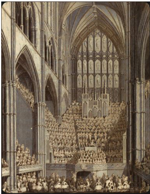
Илл. 19. День памяти Г.Ф. Генделя в Вестминстерском аббатстве, 1784 год

После сего следовало пение: Приидите поклонимся 157 и пр. и хор из Саула 158 : Опояси себя и пр. Между тем в первом действии превосходила всё сочиненная на Утрехтский мир в 1713 году песнь: Слава Отцу 159 и пр. Чем труднее совершенное представление оной, тем к большей чести музыкантов служит, что она сыграна и пропета была весьма прекрасно. Второе действие состояло большей