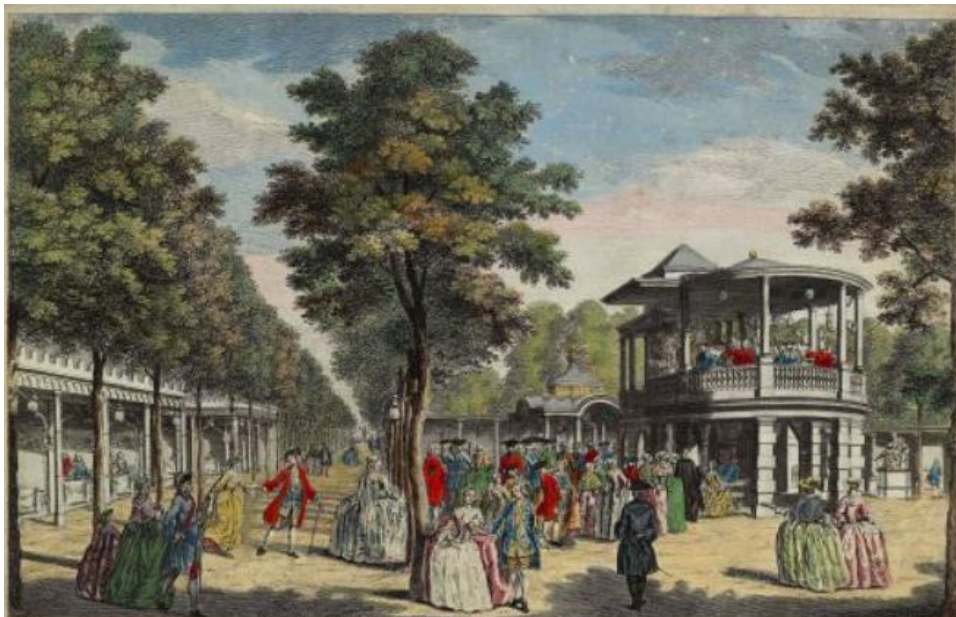
Илл. 17. Воксхолл-Гарденз в Лондоне в XVIII в.