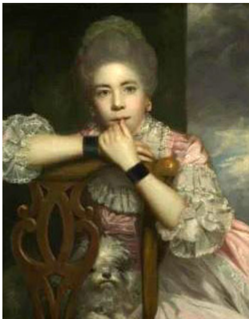
Илл. 18. Портрет мисс Абингтон. Худ. Дж. Рейнольдс

Вчера была в церкви Св. Павла церковная музыка, и зрелище гораздо трогательнее Вестминстерского. Это были 6398 мальчиков и девочек, кои яко сироты добровольными подаяниями благомыслящих особ одеты в новое платье, накормлены, научены и на сооруженном в церкви амфитеатре пред несколькими тысячами собравшихся зрителей прославляли цену благодетельной добродетели, и с молчанием взывали к достаточным особам: поди и ты сделай тоже.