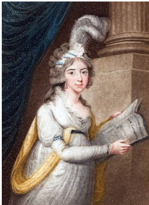
Илл. 25. Портрет Бр. Банти-Джорджи. Худ. С. Копли. 1796